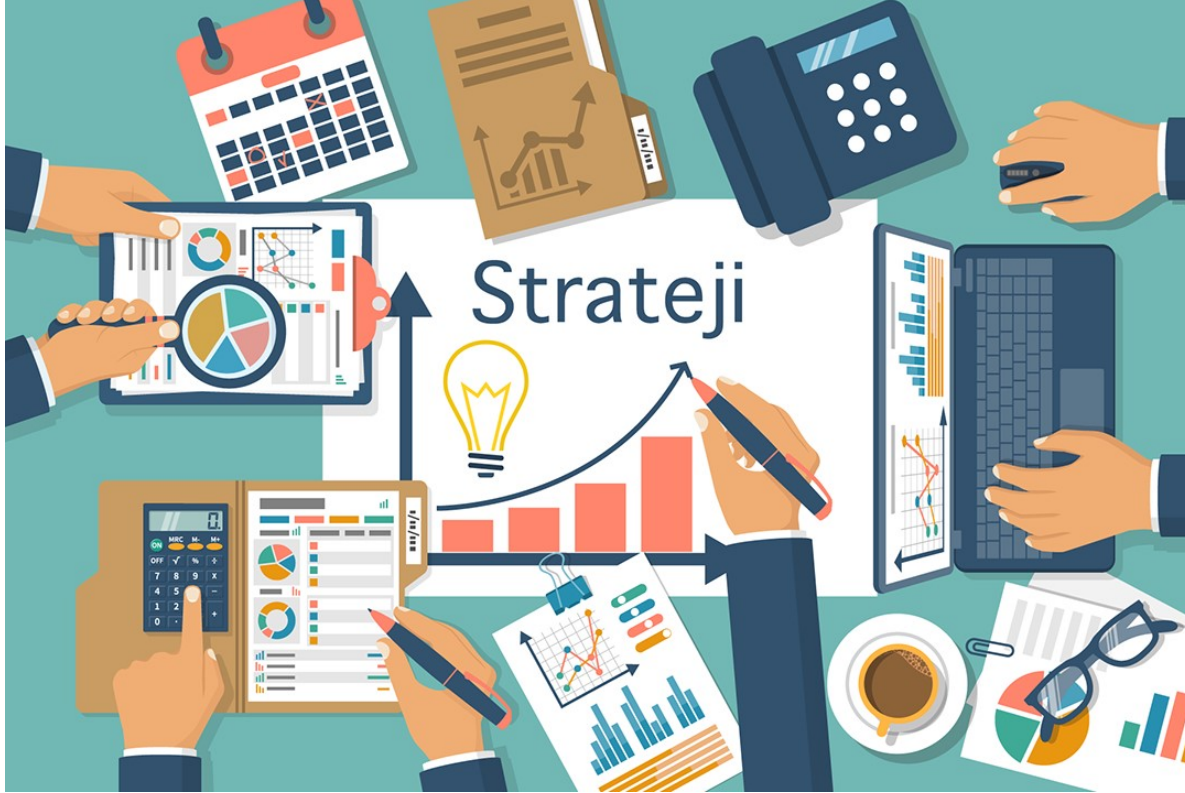
Şekil 3 Stratejik Plan Durum Analizi