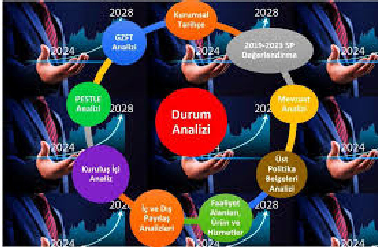
Şekil 1-Durum Analizi Çalışmaları