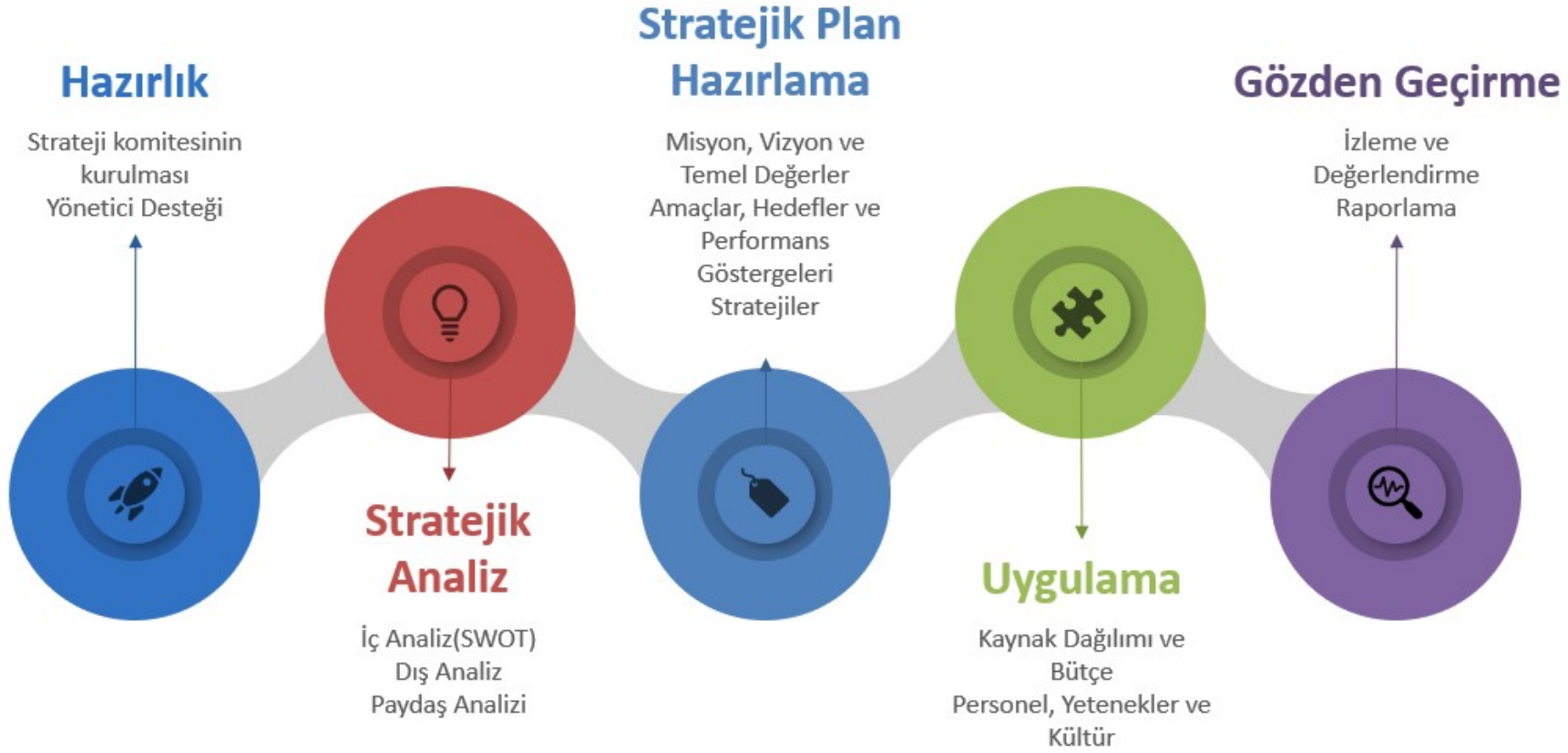
Şekil -2 Stratejik Plan Hazırlama Şeması